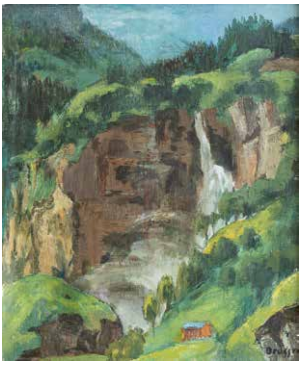
Arnold Brügger, 1888–1975 «Wasserfall» Öl auf Leinwand, 65 x 54 cm